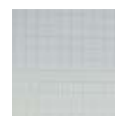
Maille 50 x 50 mm